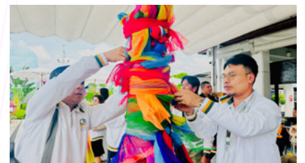
** ภาพบรรยากาศผู้บริหาร และพนักงานสักการะ สิ่งศักดิ์สิทธิ์ภายในศาลหลักเมือง ประกอบด้วย อาคารหอพระพุทธรูป / ศาลจำลองผูกผ้าแพร 3 สี / อาคารศาลหลักเมือง / ศาลเทพารักษ์ห้อง 5 / และเติมน้ำมนต์ตะเกียง